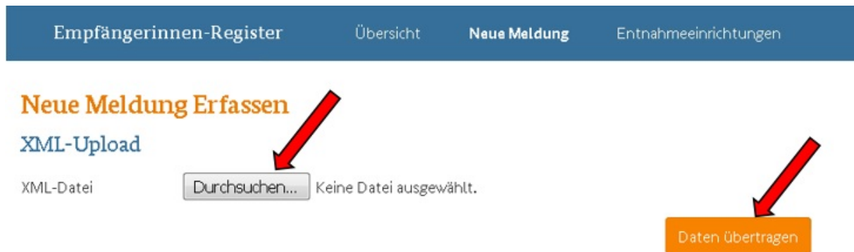
Abbildung 10: XML-Upload im Empfängerinnen-Register

Um das Formular per XML-Upload auszufüllen, klicken Sie zunächst auf der Übersichtsseite auf „Neue Meldung“. Mit einem Klick auf „Durchsuchen“ können Sie die lokal auf Ihrem Rechner gespeicherte XML-Datei auswählen. Anschließend klicken Sie bitte auf „Daten übertragen“.